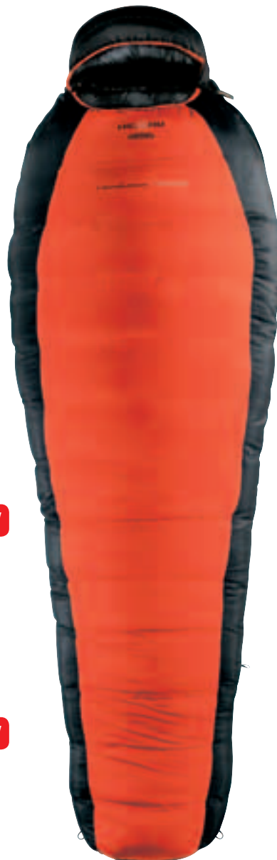
HL REVOLUTION 1200 W.T.S.