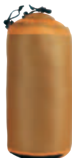
Custodia in nylon 244T 33D Ripstop siliconato leggerissimo Stuff sack in ultra-light, silicon-coated 244T 33D Ripstop nylon