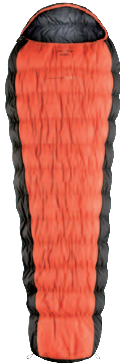
HL REVOLUTION 510/350 W.T.S.