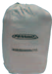
Sacchetto per stoccaggio Storage sack (Revolution 1200/510)