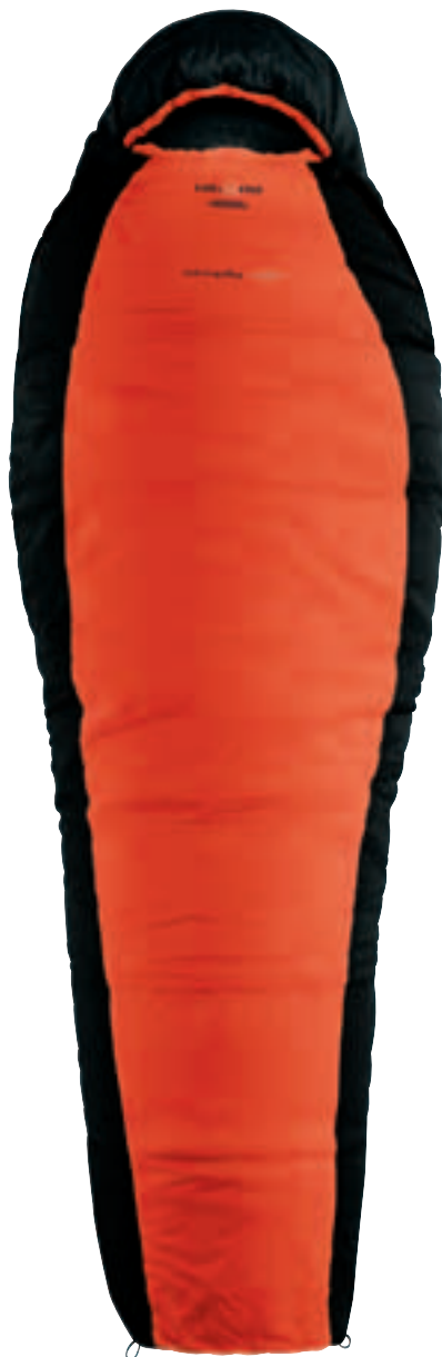
HL SIMPLY W.T.S.

L'imbottitura in microfibra e la costruzione W.T.S. consentono un alto potere isolante in tutte le condizioni atmosferiche.